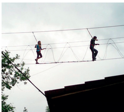
Ein Gerüst schaffen um plötzliche, schwierige Situationen zu meistern.

Vier Familien haben unser Projekt kürzlich erfolgreich verlassen, zehn Löwenkinder werden aktuell gefördert. Doch die Warteliste ist lang.